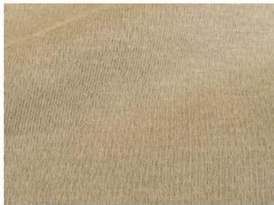
裏:ポリエステル65%・綿35%